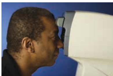
正确的患者对位 (下颏靠近仪器)