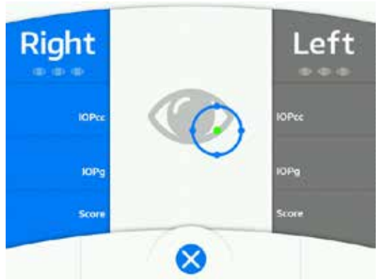
LCD 屏幕上的测量过程