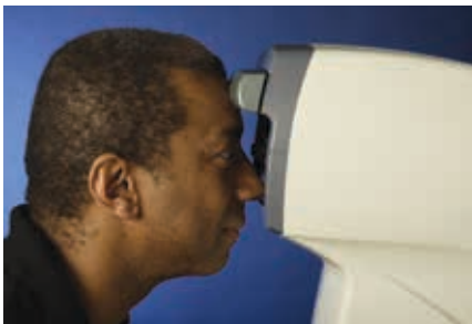
Richtige Ausrichtung des Patienten (Kinn nahe am Gerät)