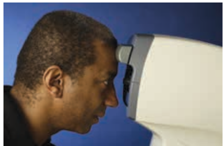
Falsche Ausrichtung des Patienten (Kinn zu weit weg vom Gerät)