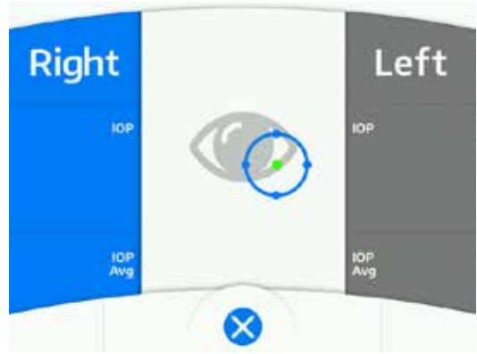
Messvorgang auf dem LCD-Bildschirm

6 Im Zuge des Positionierungsvorgangs ändert sich die Anzeige auf dem Bediener-Display, sodass sie in etwa der Abbildung rechts entspricht. Sobald sich das Positionierungssystem ausgerichtet hat, wird der Luftstoß auf das Auge abgegeben und das Messergebnis auf dem Bildschirm angezeigt.